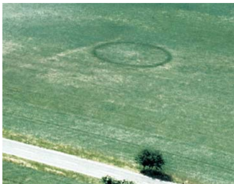
Abb. 1 Bad Lippspringe-Dedinghausen, Kr. Paderborn. Auf dem 1987 aus einem Flugzeug aufgenommenen Foto hebt sich deutlich die kreisrunde Spur ab.

Was das Luftbild nicht erkennen ließ, sondern erst die Grabungen erbrachten, waren fünf große runde Gruben, von denen sich vier im Innenraum der durch den Graben umschlossenen Fläche befanden, während die fünfte im Westen vorgelagert war. Die Gruben besaßen einen Durchmesser von ca. 1,40 m und waren durchschnittlich 1,30 m tief (Abb. 3). Auf dem Grubenboden lagen Knochen vom Hausschaf und vom Hasen. Weiterhin bargen sie Scherben tönerner Gefäße, die allerdings zu schlecht erhalten waren, um Gefäßformen rekonstruieren zu können. Ihre zeitliche Bestimmung und damit auch die der Gruben ließ daher nur die Einordnung in vorgeschichtliche Zeit zu. Aber auch hier konnte aus zwei der nahezu identischen Gruben Holzkohle geborgen werden, durch die ihr Alter bestimmbar wurde. Danach waren sie im 5. Jahrhundert vor Christus in Benutzung und damit nahezu 400 Jahre