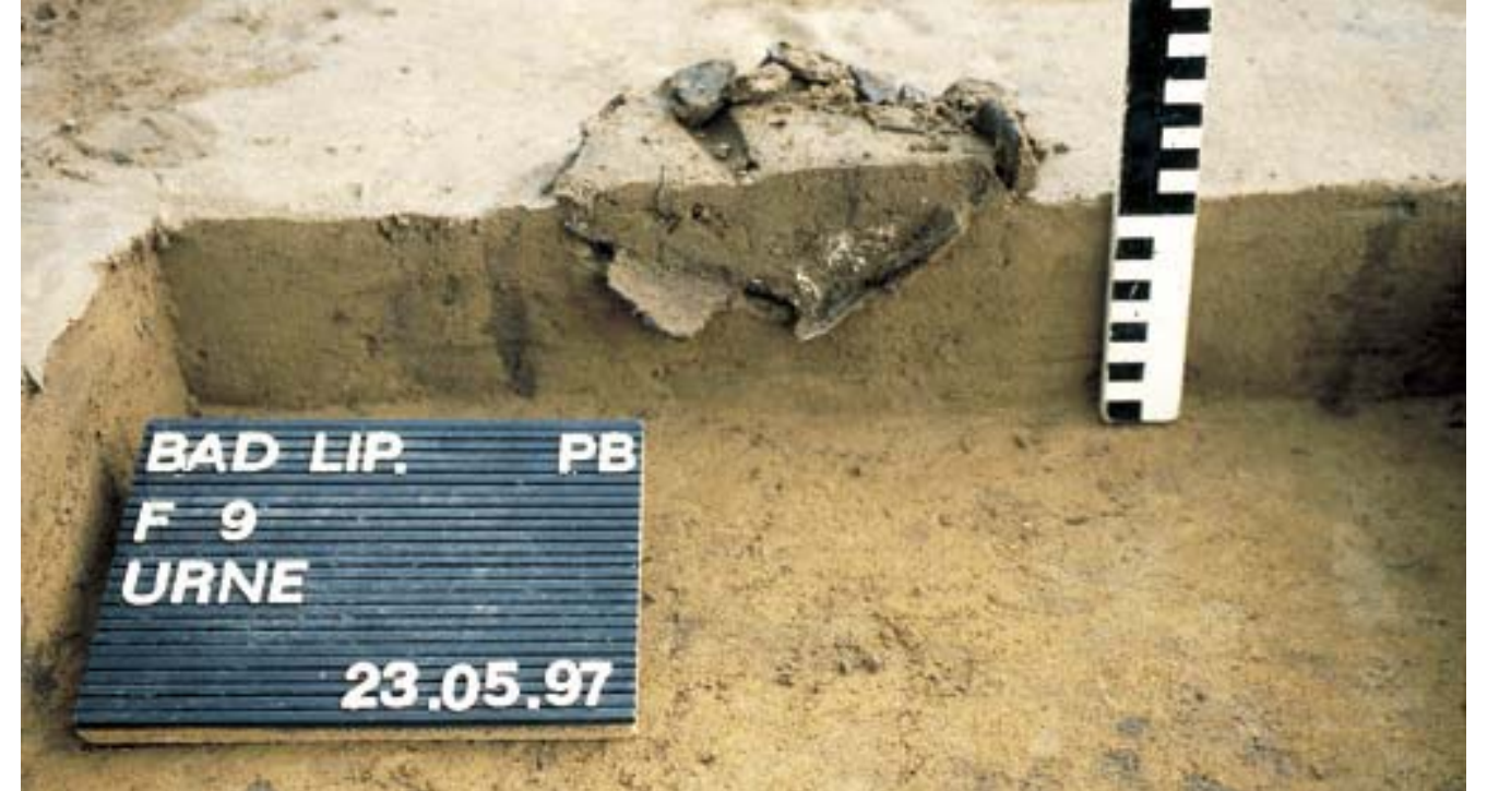
Abb. 4 Reste einer weitgehend zerstörten bronzezeitlichen Urne während der Ausgrabung.

Weitere Befunde oder Funde ließen sich innerhalb des durch den Graben eingegrenzten Areals nicht nachweisen. Allerdings wurden überraschender Weise außerhalb des Ringes mindestens fünf Brandgräber entdeckt. Sie befanden sich unmittelbar unter dem Mutterboden und waren in ihren oberen Bereichen schon durch landwirtschaftliche Bodenbearbeitung zerstört. Die verbrannten menschlichen Knochen, der sog. Leichenbrand, zeigten sich in Form kleiner weißer Stippen, die verstreut zwischen Scherben vom Pflug zerstörter Urnen lagen (Abb. 4). Obwohl die Urnen zu großen Teilen zerstört und nur in vielen kleinen Scherben erhalten