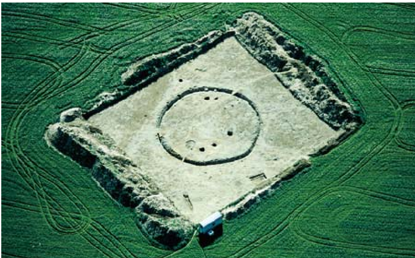
Abb. 6 Bad Lippspringe-Dedinghausen, Kr. Paderborn. Ein Luftbild nach der Freilegung der Kreisgrabenanlage. Hell grenzt sich das vom Mutterboden abgeschobene Grabungsareal im grünen Feld ab. Die Einhegung mit der Erdbrücke ist ebenso deutlich sichtbar wie die eisenzeitlichen Gruben und die Grundfläche des kaiserzeitlichen Grubenhauses.

H. KRÖGER, Die Kreisgrabenanlage von Warburg-Daseburg, Kr. Höxter. Archäologie in Ostwestfalen 3, 1998, 23 - 28.