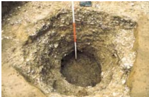
Abb. 3 Bad Lippspringe-Dedinghausen, Kr. Paderborn. Blick in eine der eisenzeitlichen Gruben.

Ein weiterer Befund konnte durch die Grabungen im Inneren des Grabenringes nachgewiesen werden: die unteren Reste eines sog. Grubenhauses (Abb. 2,4). Grubenhäuser waren kleine rechteckige Gebäude, die, in der Regel Ost-West orientiert, in den Boden eingetieft waren. Hier betrug die Grundfläche des Hauses 2,40 m Breite und 3,20 m Länge. Es handelte sich um ein Giebelpfostenhaus, da die Konstruktion des heute nicht mehr erhaltenen Aufgehenden im wesentlichen durch zwei Giebelpfosten stabilisiert wurde. Ihre Spuren waren als schwarze Verfärbungen an der westlichen und östlichen Schmalseite als kleine runde Ausbuchtungen erkennbar. Nach Ausweis der Keramik, nämlich kleiner, durch Fingerkniffe verzierter Gefäße, datiert dieses Gebäude in das beginnende erste nachchristliche Jahrhundert.