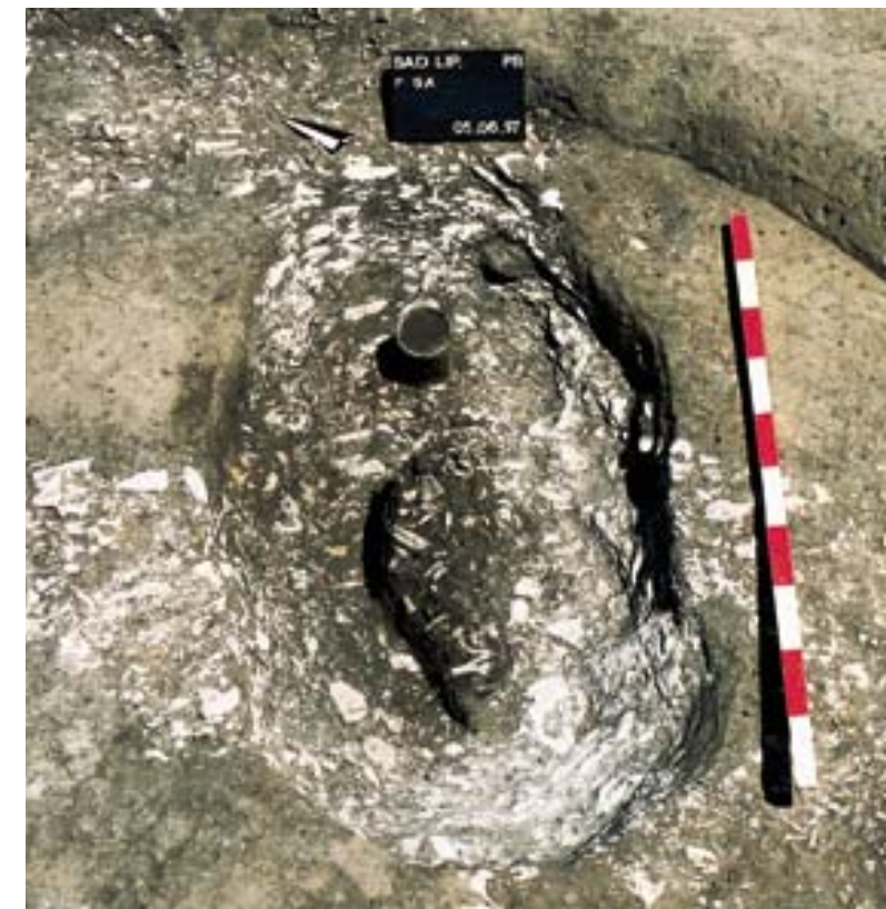
Abb. 5 Bad Lippspringe-Dedinghausen, Kr. Paderborn. Das Brandskelettgrab. In einer in den kalkplattigen Untergrund eingebrachten Grube liegen in kompakter länglich-ovaler Form die schlecht verbrannten Knochen einer etwa 40jährigen Frau. Am oberen Rand des Leichenbrandpaketes steht als Grabbeigabe ein kleines tönernes Gefäß.

Unbestreitbar ist, dass durch die Anlage des Grabens eine Fläche deutlich sichtbar abgegrenzt wurde