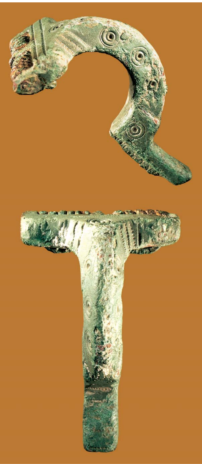
Abb. 3: Spät-römische Stützarmfibel aus dem Raum Soest, L. 5,8 cm.