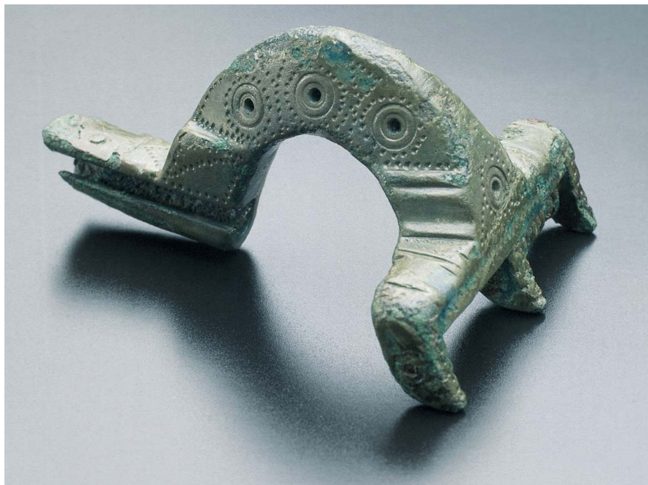
Abb. 1: Spätrömische Stützarmfibel aus Werther-Isingdorf, L. 7 cm.

Im April 2001 wurde in der Außenstelle Bielefeld des Westfälischen Museums für Archäologie/Amt für Bodendenkmalpflege ein außergewöhnlicher Fund eingeliefert, der von einem Acker des Hofes Meyer zu Gottesberg in Werther-Isingdorf, Kr. Gütersloh, stammt (Abb. 1). Es handelt sich um eine bronzenne Fibel, die in die Gruppe der „Stützarmfibeln mit stabförmigem Bügel und Achsen-träger“ nach H. W. Böhme einzuordnen ist (H.W. BÖHME 1974, 51 f.).