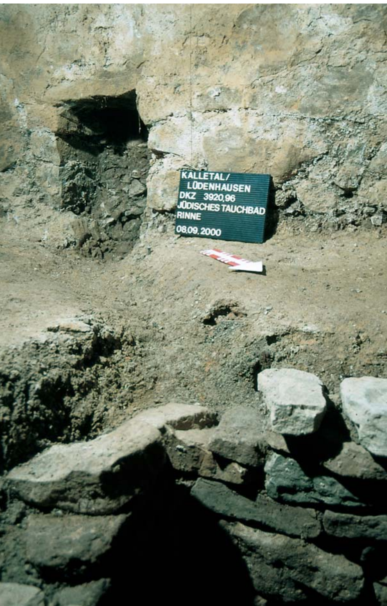
Abb. 6: Kalletal-Lüdenhausen. Durch eine Öffnung in der Wand konnte Wasser vom nahe gelegenen Bach in das Becken geleitet werden.