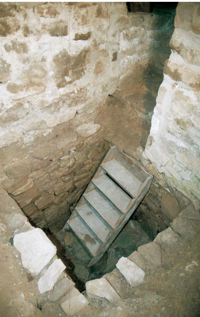
Abb. 4: Kalletal-Lüdenhausen. Das Becken wurde ursprünglich über eine Holzstiege betreten. Sie ist nicht erhalten, könnte aber ähnlich ausgesehen haben.

78 Grundwasser anfüllte. Bei längerer Trockenheit und dadurch sinkendem Grundwasserspiegel konnte im Bedarfsfall von der nur wenige Meter am Haus vorbeifließenden Osterkalle (Abb. 2) durch eine gemauerte Aussparung in der Wand und eine Rinne, die sich noch im gewachsenen Boden abzeichnet, zusätzliches Wasser in das Becken geleitet werden. Ursprünglich lief das Wasser sicherlich durch Röhren, die heute nicht mehr vorhanden sind. Ob eine Tonröhre, die sich in der westlichen Ecke unterhalb des Kellerfundamentes befindet, ebenfalls in Zusammenhang mit dem Ritualbad zu sehen ist, konnte bislang nicht sicher geklärt werden. Da das Becken bei hohem Grundwasserspiegel überläuft, ist es denkbar, dass es sich dabei um einen Überlaufschutz handelt, der überschüssiges Wasser in den Bach zurückleitete. Diese Frage kann möglicherweise beantwortet werden, wenn im Zuge der weiteren Sanierungsmaßnahmen im Außengelände Eingriffe in den Boden stattfinden.