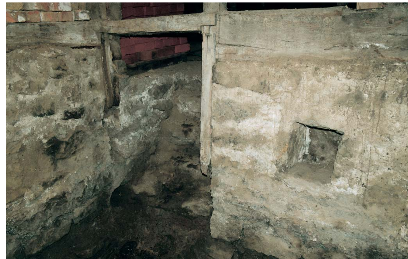
Abb. 5: Kalletal-Lüdenhausen. Neben der Kellertür befand sich oberhalb des Tauchbeckens eine Nische, in der ein Licht abgestellt werden konnte.

Die Geschichte der Juden in Westfalen kann bis in das Mittelalter zurückverfolgt werden, als sich im 12. und 13. Jahrhundert Menschen jüdischen Glaubens in den neu gegründeten Städten niederließen. Bis in die Mitte des 14. Jahrhunderts sind sie nur vereinzelt nachweisbar, auch wenn aus Städten wie Münster, Minden oder auch Soest selbständige Gemeinden bekannt sind. Vor allem im 14. Jahrhundert wurden die Juden für Katastrophen wie die Pest oder auch die Verseuchung von Brunnen verantwortlich gemacht und es kam zu einer großen Auswanderungswelle deutscher Juden, vor allem nach Polen. Zusätzlich erfolgte eine Abwanderung aus den Städten in ländliche Regionen. Um sich an einem Ort niederzulassen, benötigten die Juden die Schutzsage des jeweiligen Landesherrn in Form eines Geleitbriefes, den er für einen befristeten Zeitraum ausstellte. Auf diese Weise bestand für ihn die Möglichkeit, gezielt jüdische Familien auszusuchen und dort anzusiedeln, wo ihre Anwesenheit ihm wirtschaftlich von Nutzen war. Durch die Schutzbriefe bestand eine wechselseitige Beziehung: Der Landesherr gewährte „Geleit, Schutz und Schirm“, die u. a. das Wohnrecht, eine Gewerbeerlaubnis für bestimmte Bereiche wie Handel und